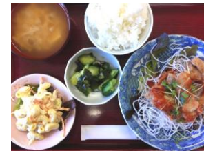
●鶏のから揚げレモンソース